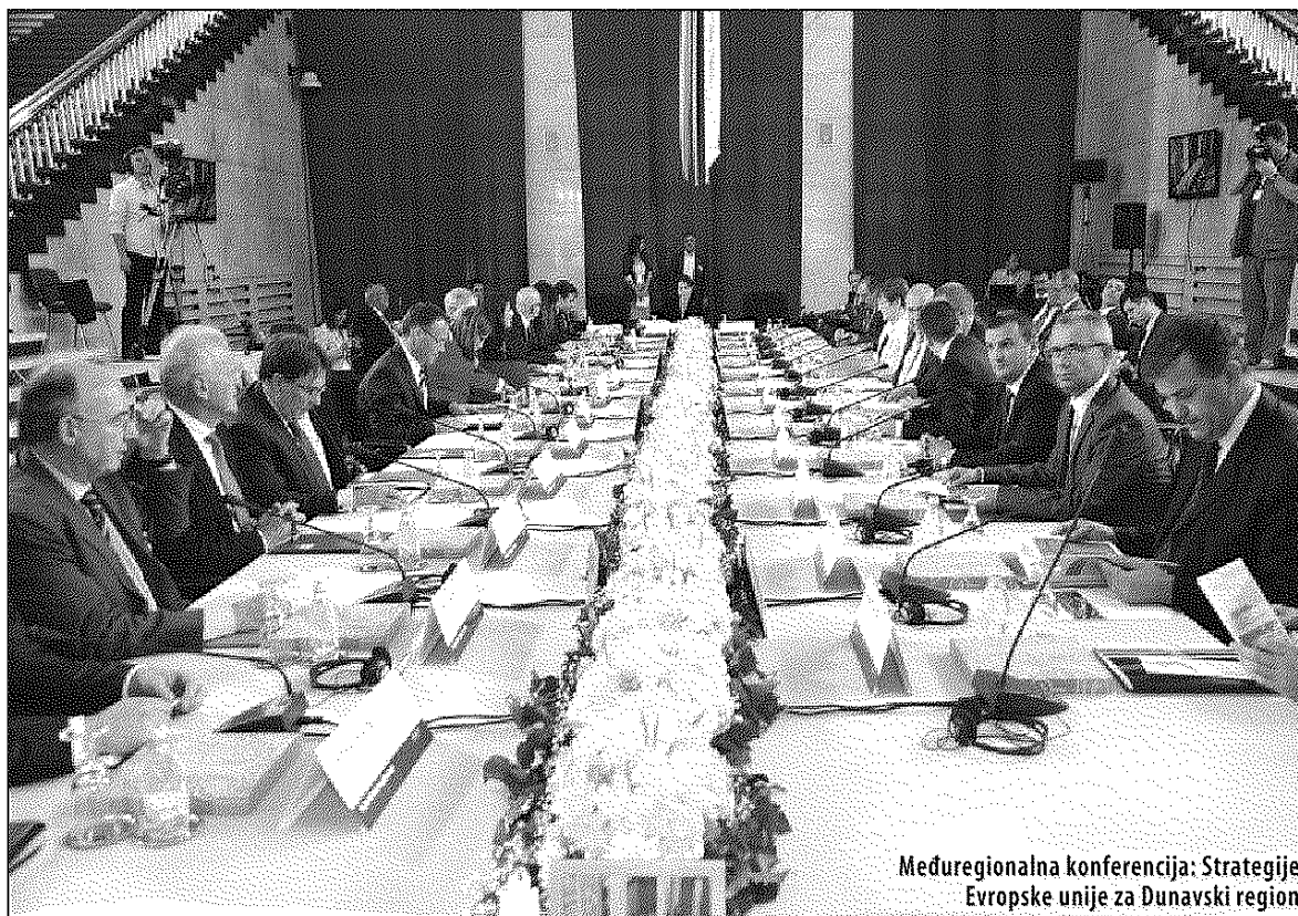
Međuregionalna konferencija: Strategije Evropske unije za Dunavski region

koje su u sastavu Evropske unije: Nemačke, Francuske, Italije i Španije. Na konferenciji su učestvovali i delegacije iz regiona susednih država Mađarske, Hr-